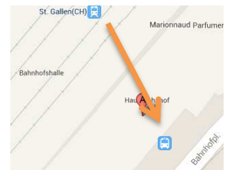
Plan de situation gare de SG